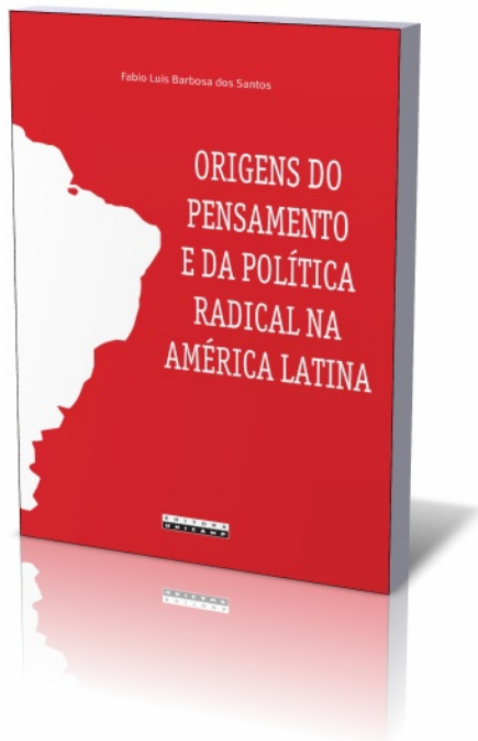
Fabio Luis Barbosa dos Santos. Origens do pensamento e da política radical na América Latina . Campinas: Editora da Unicamp, 2016.

discutidos detidamente no livro: o satisfazimento, a racionalidade limitada e a racionalidade procedimental. As organizações, por sua vez, constituem um elemento de contexto predominante do comportamento econômico, fornecendo muitas das premissas de decisão e influenciando de diversas maneiras o ambiente subjetivo de decisão dos agentes, permitindo a estes atingir graus mais elevados de racionalidade do que seria possível individualmente. O livro está disponível para download gratuito: Racionalidade e organizações.pdf