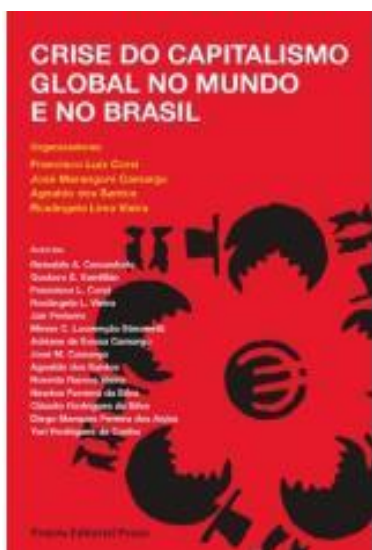
CORSI, Francisco Luiz et al. (Orgs.). Crise do capitalismo global no mundo e Brasil . Baururu: Canal Seis/Praxis, 2013. v. 1

Os acordos regionais de integração não interessam apenas o comércio internacional; eles são um componente indissociável da economia mundial contemporânea. Atualmente, e de forma crescente, grande parte do comércio internacional ocorre entre blocos comerciais ou acordos regionais de integração, que constituem assim uma configuração relevante da história econômica das últimas décadas. Este livro analisa a história, as configurações institucionais, os impactos econômicos e os principais experimentos regionais existentes no mundo, com uma ênfase sobre seu potencial discriminatório e possíveis incompatibilidades para o sistema multilateral de comércio.